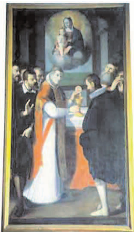
Một tranh họa cổ miêu tả Phép lạ