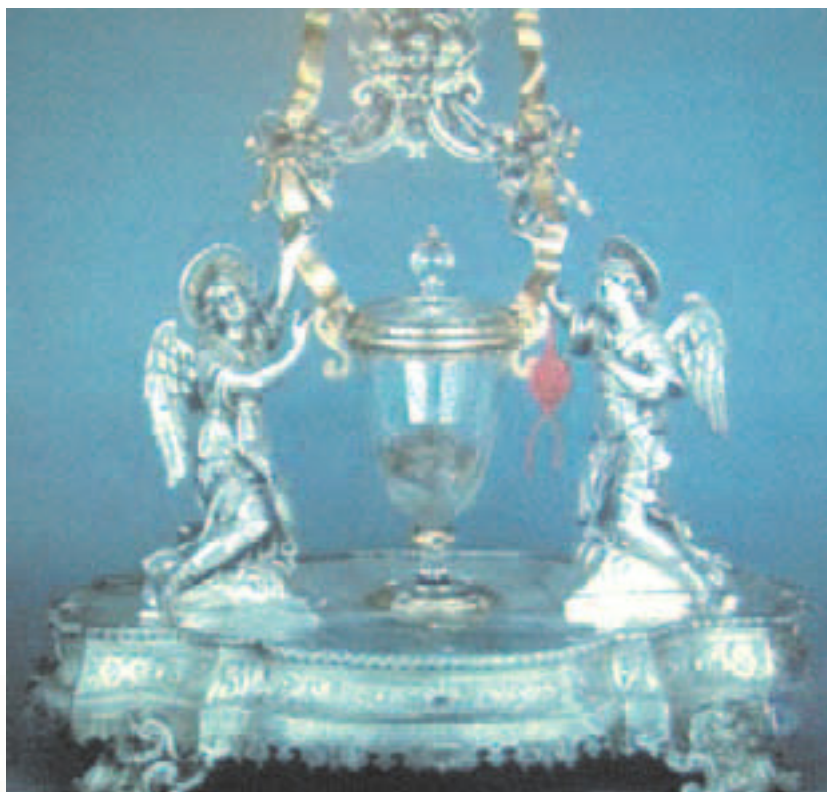
Thánh tích từ thế kỷ 18 lưu trữ Thánh Thể và Máu khô, quà tặng do Domenicô Coli.

Thịt và Máu của Phép lạ Lanciano hoàn toàn giống như thành phần máu thịt thuộc về một người sống, vừa mới lấy ra cùng trong ngày